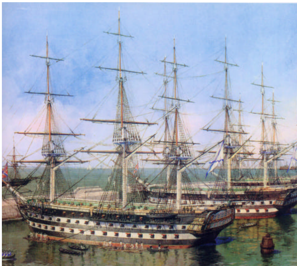
Navío Fernando VII (74 cañones)

Como un inciso os debo decir que la Romana inició su carrera militar en la Marina donde alcanzó el grado de Capitán de Fragata. Cuando España declaró la guerra a Francia, con motivo de la ejecución de Luis XVI, La Romana fue requerido por su tío, el General Caro, Virrey de Navarra, para que le ayudara a organizar la defensa de sus fronteras. Pasó al ejército con el grado de coronel, terminándola durante la Guerra de la Independencia, por una neumonía, cuando se dirigía a ponerse al frente del ejército de Extremadura.