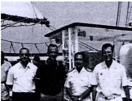
[El autor de esta reseña, (segundo por la izquierda) a bordo del Juan Sebastián de Elcano

Tras el recibimiento a bordo, a cargo del Segundo Comandante, y el alojamiento (primera ocasión para practicar la "escalada" o el "cuerpo a tierra" como técnica previa a la hora de acostarse en las literas asignadas), tuvo lugar la maniobra de salida de puerto.